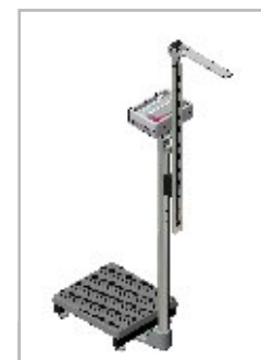
Sposoby montażu wzrostomierza SECA