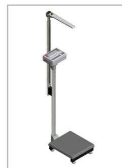
Sposób montażu wzrostomierza ADE